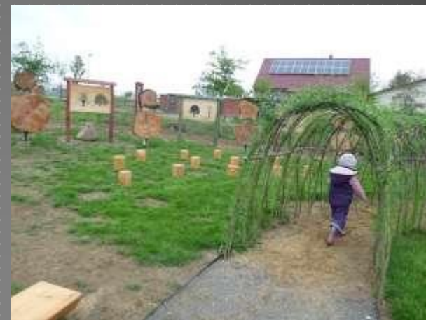
Přírodní zahrada MŠ Ratměřice, dokončení v roce 2016 (OPŽP)